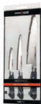
SP-0220 НАБОР ИЗ ТРЕХ НОЖЕЙ SP-0010, SP-0023, SP-0085